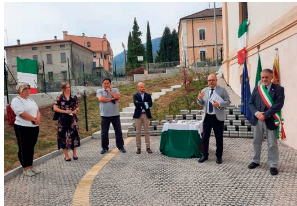
La cerimonia di consegna dei 7 alloggi alle famiglie

Nel Quartiere Operaio A. Rossi di Piovene Rocchette l'Ater ha, nel corso degli anni, ottemperato a quanto previsto nel Piano di Recupero già approvato nel 1999 e successivamente oggetto di tre varianti, l'ultima del 2011, indirizzandosi alla parte storica e al suo intorno mediante la ricomposizione e la salvaguardia dello scenario storico e delle presenze architettoniche. Grazie al reperimento di risorse economiche con finanziamenti regionali per il recupero urbano e fondi propri dell'Ater, per un investimento complessivo di circa 11 milioni di euro, sono state recuperate all'interno dell'area di conservazione 99 unità abitative e sono state realizzate 36 autorimesse interrato.