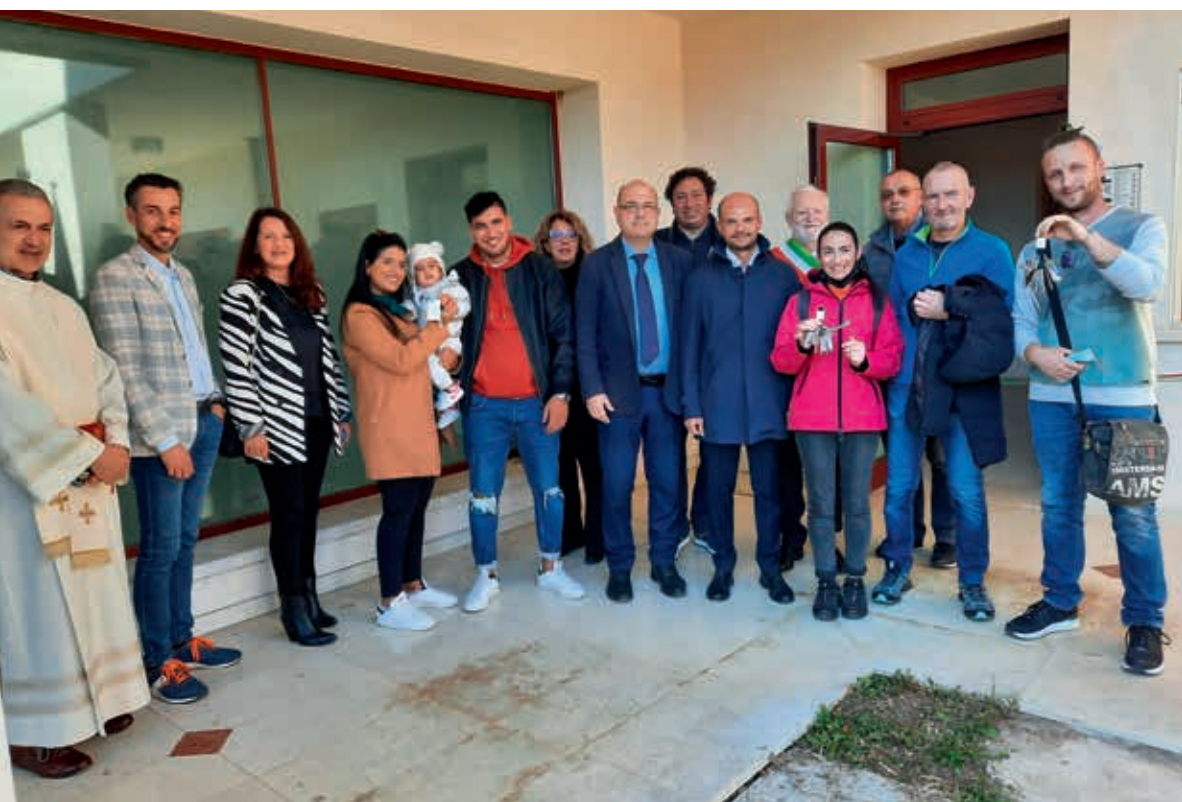
Foto di gruppo con i nuovi inquilini e le autorità