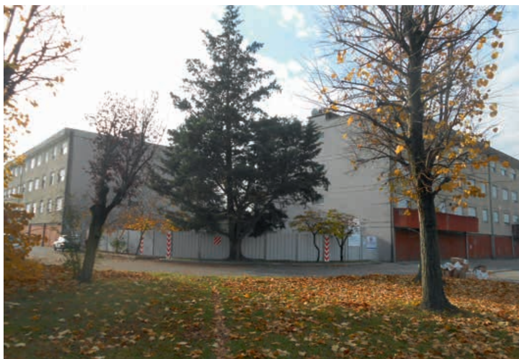
Il complesso edilizio di via della Repubblica con i due edifici di Erp

Un milione 365 mila euro di spesa per l'Azienda al complesso edilizio di via della Repubblica, conclusione lavori prevista per la prossima estate