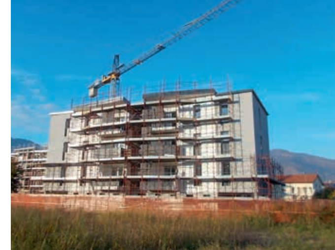
Il cantiere di via Tuzzi a Magrè, Schio

A Schio procede il cantiere di via Tuzzi a Magrè, dove sono in fase di costruzione due fabbricati per complessivi 18 alloggi: l'immobile B, 6 appartamenti (tricamere) è in fase avanzata di lavori; sull'immobile A al grezzo, 12 alloggi (di cui 6 bicame-