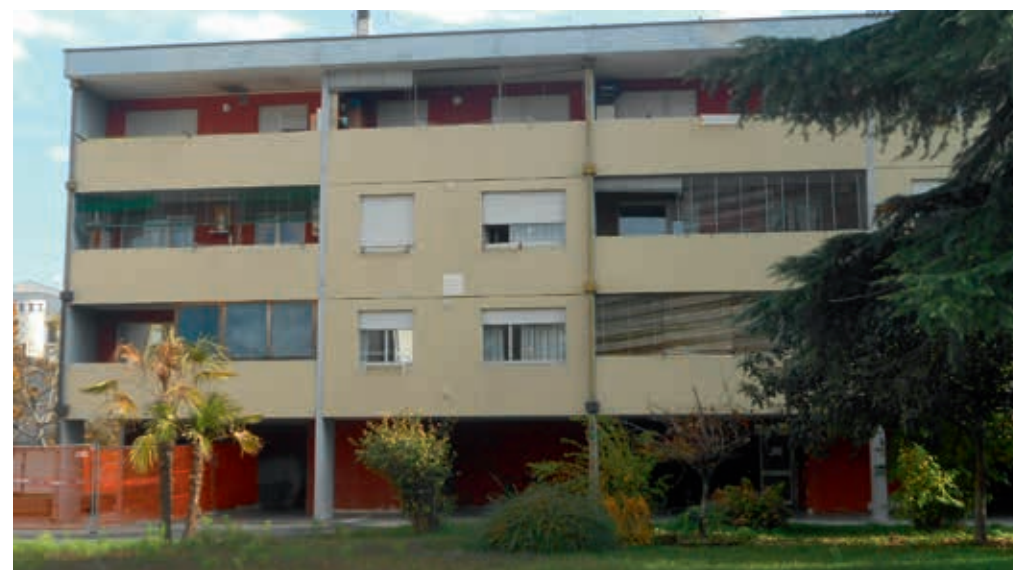
Uno degli immobili oggetto di riqualificazione energetica

minari effettuate sul sito, prevede di intervenire principalmente nell'incremento delle caratteristiche di isolamento dell'involucro esterno, con l'applicazione di un rivestimento a cappotto alle pareti perimetrali. Inoltre, in ciascun fabbricato, verranno realizzati, tra gli altri: la sostituzione dei serramenti; l'installazione negli alloggi di apparecchi per la ventilazione meccanica controllata con recupero di calore; la tinteggiatura vani scala; l'efficientamento dell'impianto di illuminazione relativo alle pertinenze degli edifici con lampade a led. L'intervento, con soluzioni tecnologiche e impiantistiche di facile utilizzo, è inserito nel programma triennale dell'Azienda 2020-2022. Previsto un investimento di circa un milione 365 mila euro, conclusione dei lavori per la prossima estate.