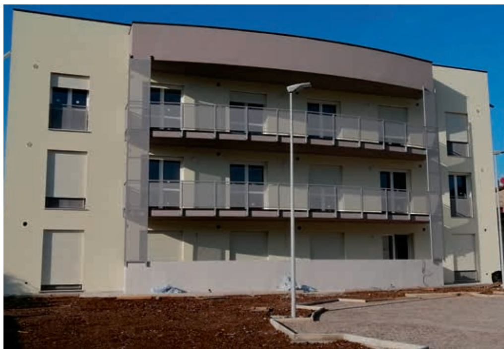
L'intervento in fase di conclusione a Malo in via Roma

Il primo a concludersi sarà l'intervento di Malo, in via Roma, dove si sta completando la realizzazione di 18