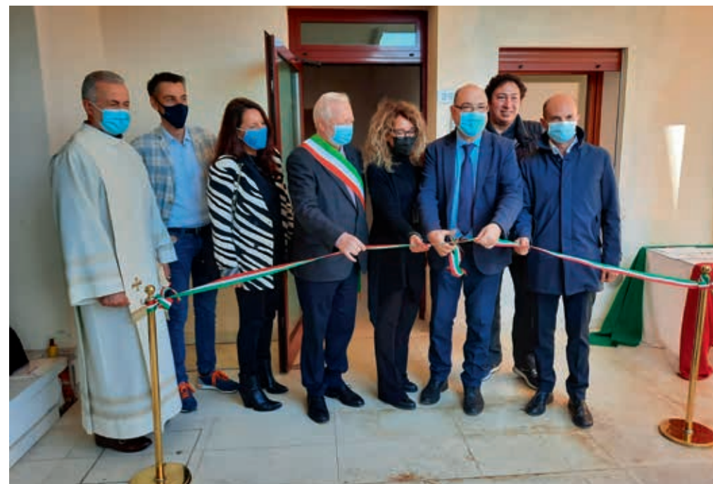
Taglio del nastro alla scala B dell'edificio di via San Tommaso

Si tratta di appartamenti in locazione a canone calmierato, contratti di 4 anni + 4 (su alcune scale con opzione di futura vendita), che hanno metrature diverse per rispondere alle differenti esigenze familiari: 23 alloggi sono dotati di una camera da letto; 21 dispongono