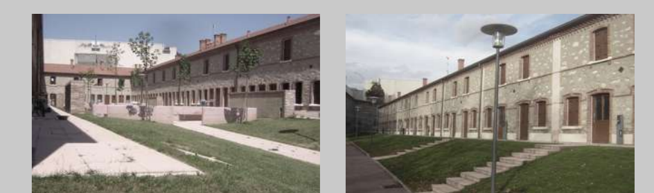
VIABILITA' DI ACCESSO PORTA INGRESSO QUARTIERE ASSENZA DI RECINZIONI SPAZIO DA ABITARE