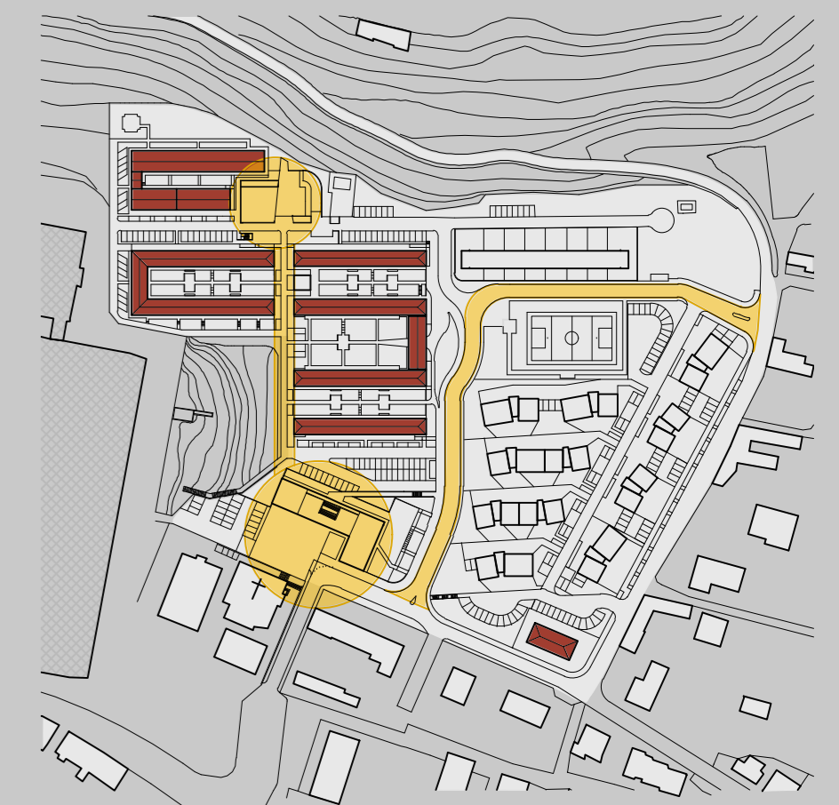
NUOVE CENTRALITA' NUOVI COLLEGAMENTI