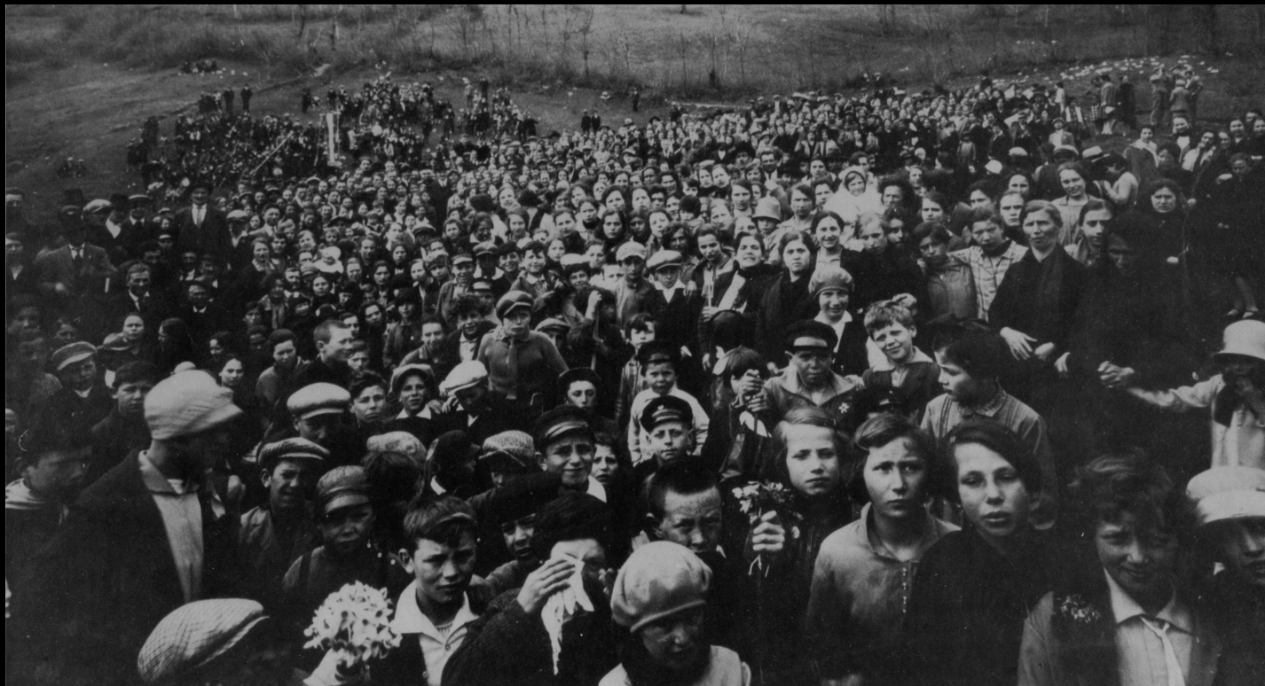
Anni Trenta, massa di gente all'Angelo in occasione del 1° maggio