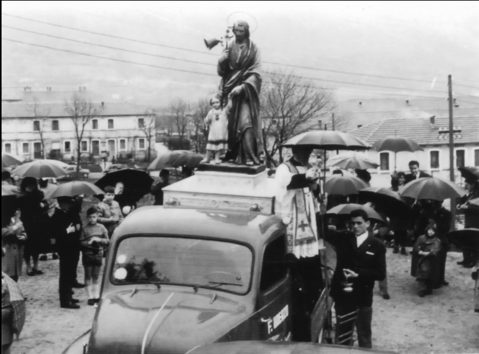
Anni Sessanta, festa di San Giuseppe. La statua del patrono di Rochette, seguita dai fedeli, attraversa il quartiere.