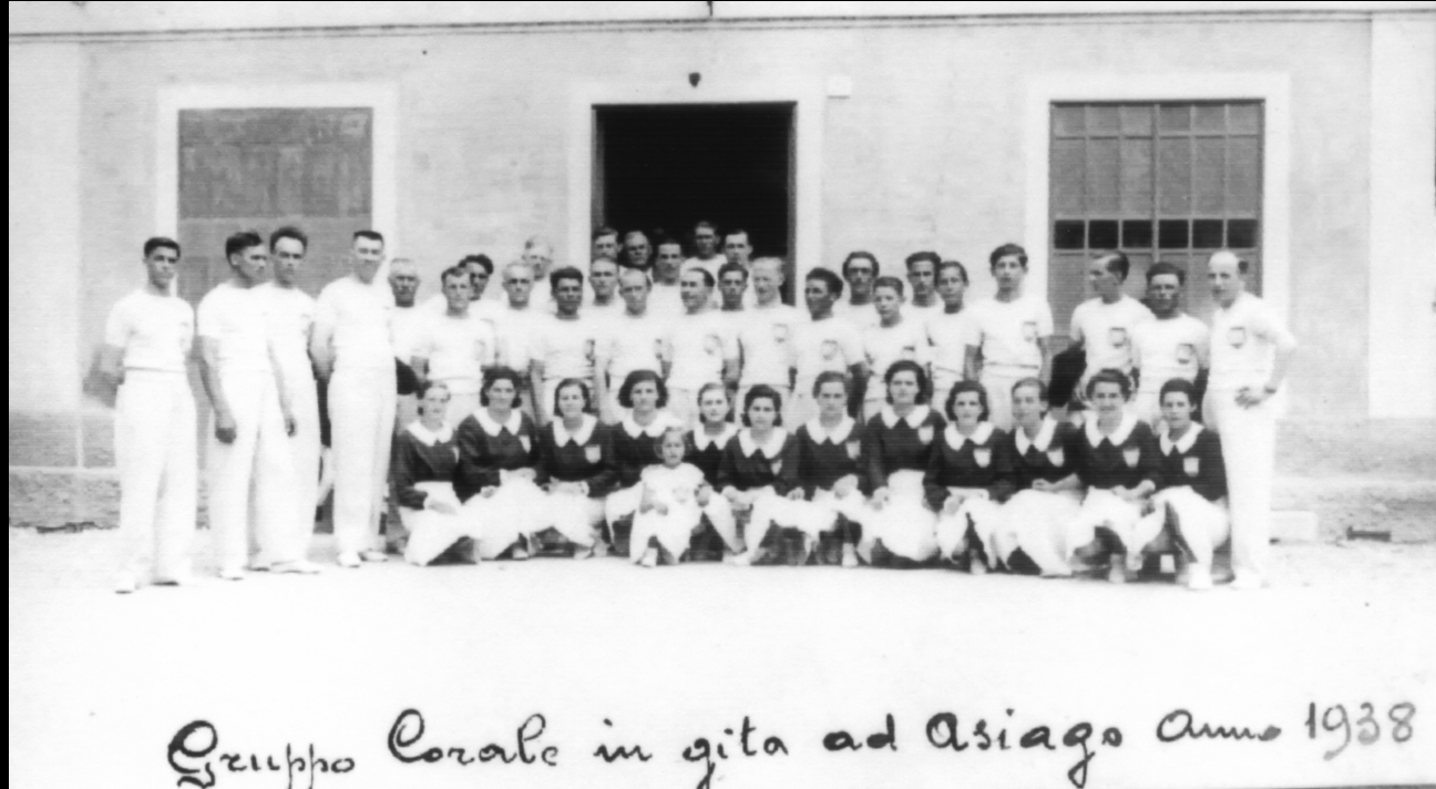
Anno 1938 Il Gruppo Corale Lanerossi in gita premio ad Asiago