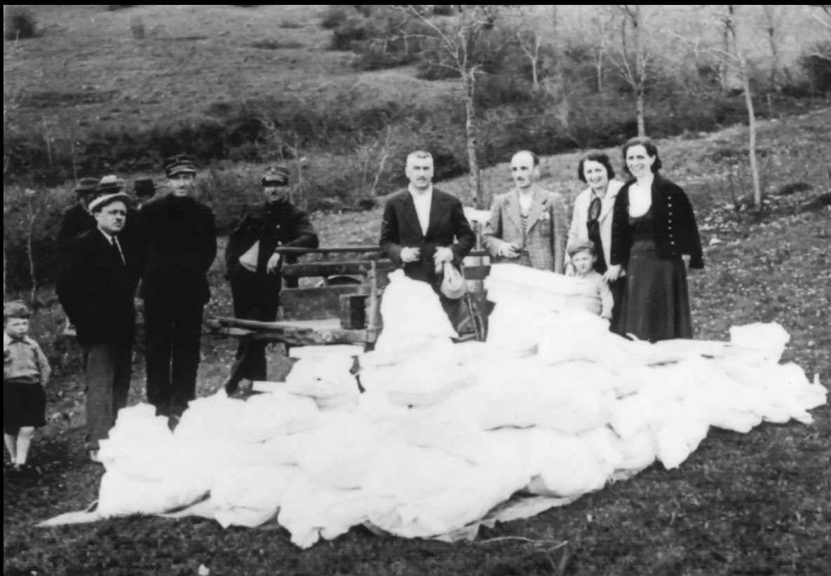
1° maggio 1934, festa dei lavoratori in località all'Angelo. Nei prati attorno al santuario della Madonna, dopo la celebrazione della Santa Messa, si teneva la classica scampagnata, a cui partecipavano centinaia di piovési. Nell'immagine, i sacchi di ristoro (contenenti panini e gazose) offerti, nell'occasione, dalla direzione Lanerossi