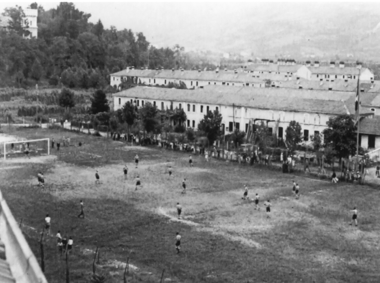
Immagine del 1938. Annesso al quartiere c'era il campo da calcio, dove si confrontavano le squadre del Dopolavoro Lanerossi. Di lato, le case operaie con alberi, "punari e gabbotti". La Lanerossi, attraverso i circoli, ha sempre sostenuto le attività sportive, dal calcio alla corsa in montagna. Fin dagli anni 40 la mitica "R" del marchio Lanerossi campeggiava sulle maglie dello Schio calcio e del Piovene calcio. Finchè, nel 1953, la Lanerossi acquista il Vicenza calcio e la celebre "R" si veste di biancorosso