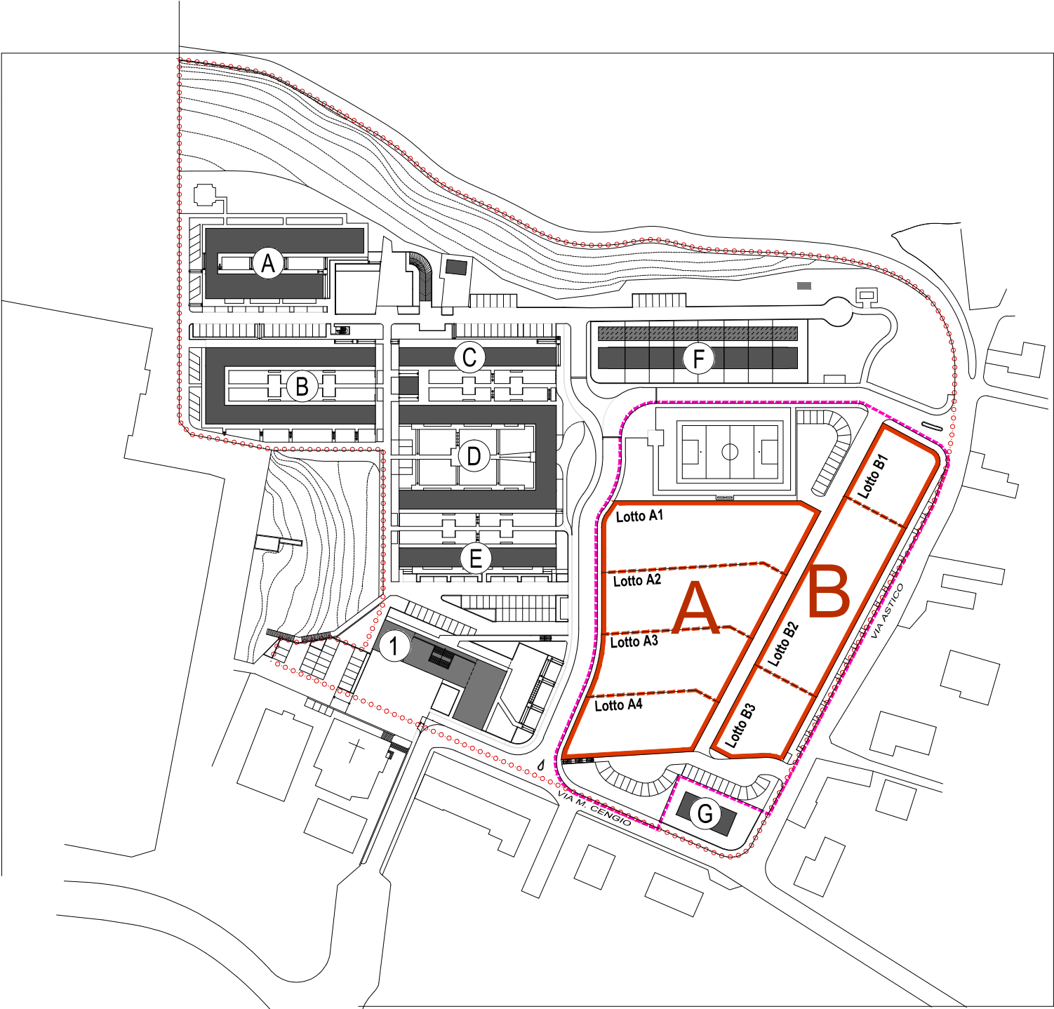
PLANIMETRIA scala 1:2000