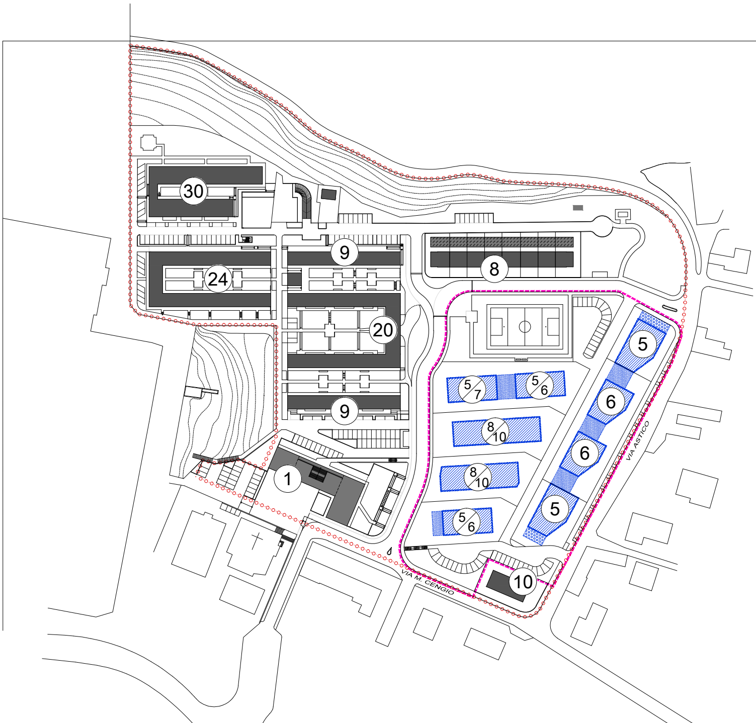
PLANIMETRIA scala 1:2000