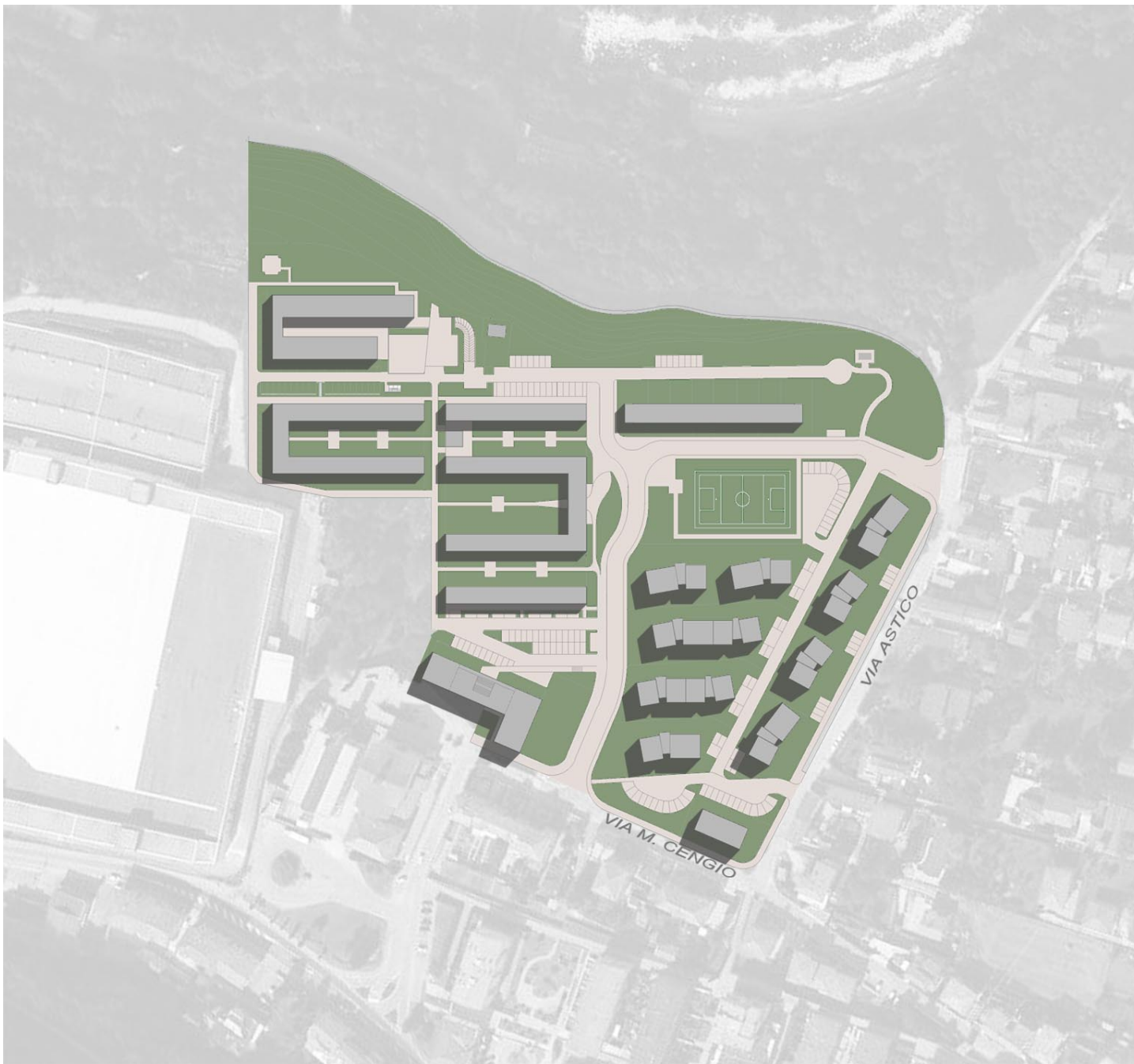
ASSETTO COMPLESSIVO DEL PIANO DI RECUPERO